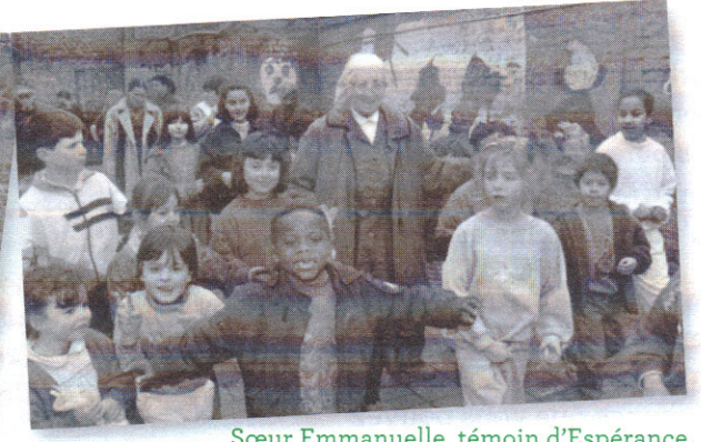
Sœur Emmanuelle, témoin d'Espérance