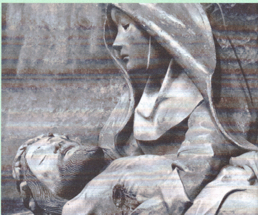
Pieta - Ariège - XVI e siècle